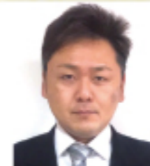
高野総合運輸株式会社 宇都宮営業所 係長

皆様が満足できる結果を得るために、広い視野で誠実に業務に取り組んで参りたいと思っております。本年も何卒宜しくお願い申し上げます。