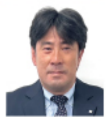
高野総合運輸株式会社 厚木営業所兼犬山営業所 所長

今年も所員一同力を合わせ配送業務に取り組みたいと思っております。本年もどうぞ宜しくお願い申し上げます。