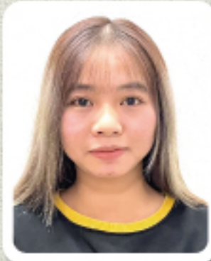
和みの社 チン・テイ・チャン