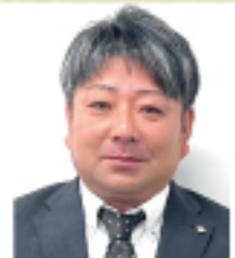
株式会社ロジサポート 所長

新年、明けましておめでとうございます。昨年中は格別のお引き立てを賜り、厚く御礼申し上げます。依然としてコロナ感染が続いておりますが、郡山営業所でも数名の感染者を出してしまい、荷主様をはじめ関係各位様にご心配、ご迷惑をお掛けしました事、心よりお詫び申し上げます。皆様に支えられて郡山営業所が稼働して早や8年目になります。この先10年、20年と続けて行く為に更なる品質向上、迅速な車両手配に努めて参ります。2024年問題に向けてまだまだ多くの課題がありますので、皆様よりご指導ご鞭撻を賜りながら改善、修正を行って参ります。本年もどうぞ宜しくお願い申し上げます。