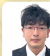
株式会社高野商運 物流部営業所 係長

コロナウイルスがまだまだ猛威を奮っておりますが、以前のように落ち着いた生活に戻ることを祈っております。2023年も原油高騰、物価上昇、円安など先行きが不透明ではありますが高野商運グループ一丸となって邁進して参ります。