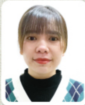
和みの社 カオ・テイ・ハン