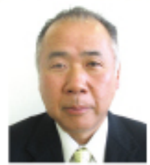
さくら流通株式会社 課長