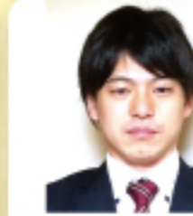
株式会社T-REX関東 係長