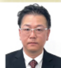
株式会社高野商運 物流部営業所 係長