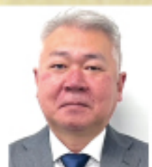
高野総合運輸株式会社 本社営業所 係長