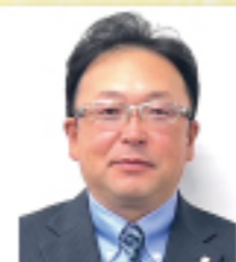
高野総合運輸株式会社 本社営業所 所長