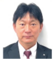
株式会社高野商運 物流部営業所 所長