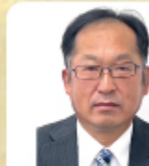
株式会社高野商運 物流部営業所 係長