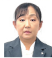
株式会社高野商運 JAしおのや営業所 所長