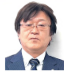
株式会社高野商運 郡山営業所 所長

明けましておめでとうございます。昨年は、大変お世話になりました。2022年は、慢性的なドライバー不足に加え、コロナや、戦争、記録的円安、などの影響が打撃となり、入社以来1番大変な年になったなと感じておりますが、無事新年を迎えることが出来ました。1日でも早くコロナの終息と平和な世界になるように願っております。今年は卯年。回復や好転する縁起がいい年と言われております。昨年達成出来なかった計画や目標を兎のように飛び越え、また新たな挑戦が出来るようT-REX関東所員一丸となり邁進してまいります。本年も何卒よろしくお願い申し上げます。